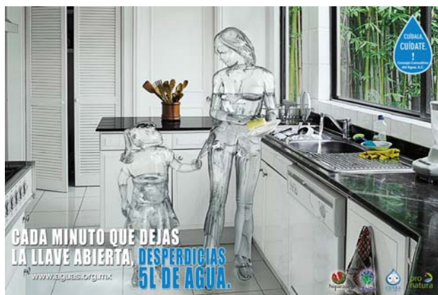
Figura 1. Postales de la campaña de comunicación “Cuidala, Cuidate”.

Diálogos del Agua también contempla acciones en la parte alta de la cuenca. Próximamente dará inicio la construcción de un módulo demostrativo de obras de retención de suelo y agua en la parte alta de la cuenca de La Paz, en donde se infiltra más